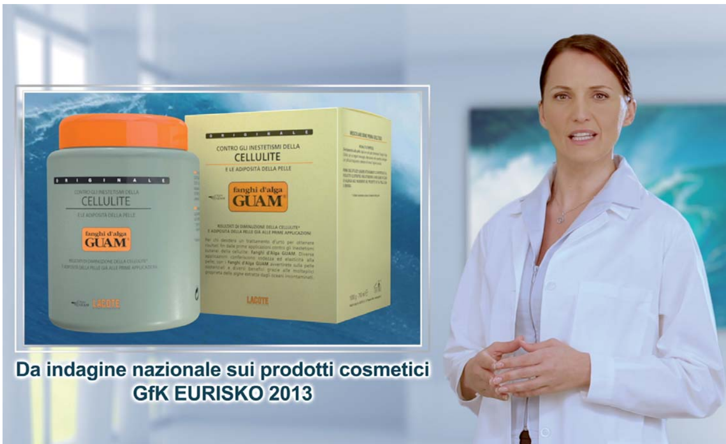
Da indagine nazionale sui prodotti cosmetici GfK EURISKO 2013