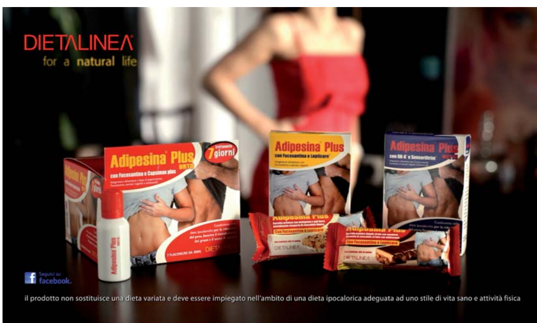
Sopra, lo spot realizzato per 'Fanghi d'alga Guam'. A lato, la campagna tv 'Adiposina Plus' girata con la regia di Francesco Nencini.

nace, pronta a ogni tipo di battaglia, in tanti campi diversi.